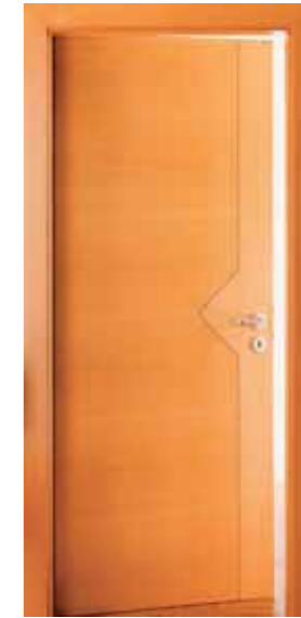
LINZ V Q