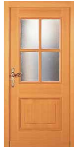
H 2 SPR