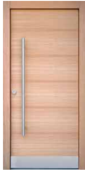
H GLATT Q

Die Haustür ist die Visitenkarte eines Hauses. Jede Rubner Tür ist ein Unikat mit unverwechselbarem Charakter und erfüllt individuelle Wünsche. Nur wer alle Eigenschaften von Holz kennt, kann diese nutzen. Bei Rubner hat dieses Wissen grossen Einfluss auf die Qualität, Entwicklung und Produktion jeder Tür. Rubner bewahrt die Tradition des Handwerks und nutzt die Präzision moderner Technologien.