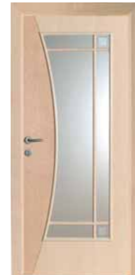
TOBLACH G SPR